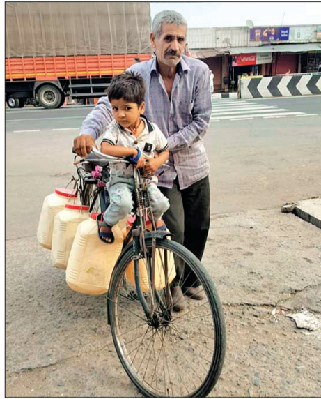
भागते हुए ही नजर आते हैं।

जब भी नल जल योजना की बात की जाती है तो मन में एक सुंदर तस्वीर शुद्ध पेयजल की निकाल कर सामने आती है, लेकिन एमपी यूटीसी के अंतर्गत रियान वाटर टैंक के ठेकेदार और अधिकारियों के कारण बहाल स्थिति के कारण आज तक यह योजना सिर्फ कागजों तक ही सिमट कर रह गई है, नगर वासियों को रोजाना शुद्ध पेयजल के लिए कई किलोमीटर का सफर तय कर रहे हैं, रोजमर्रा की जरूरत के लिए या तो यह लोग साइकिल पर कुपे लादकर दूर दराज से या तो ट्यूबवेल का या फिर किसी कुएं से पानी लेकर अपने घर तक आते हैं, कई जगह तो पानी भरने के लिए लंबी कतारों भी लग जाती है, नल जल योजना होने के बावजूद जल संकट किस कदर गहराया हुआ है यह तो जिस पर बीती है वही जानता है पर जिम्मेदार तो अपनी जिम्मेदारी से दूर